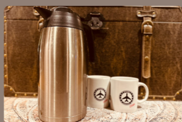
ポットサービス 2500 (2750)