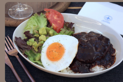
プレミアムデミのロコモコ 1099 (1209)