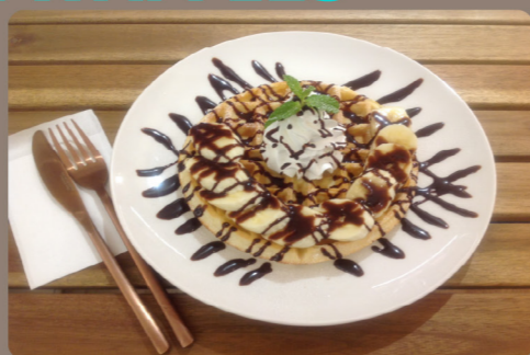
チョコバナワッフル・ホイップ 890 (979) ハーフ/600 (660)