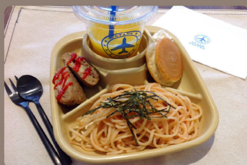
キッズプレート A・ドリンク付き 550 (605)