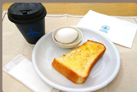
トーストセット 450 (495)