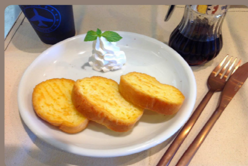
自家製フレンチトースト 750 (825)