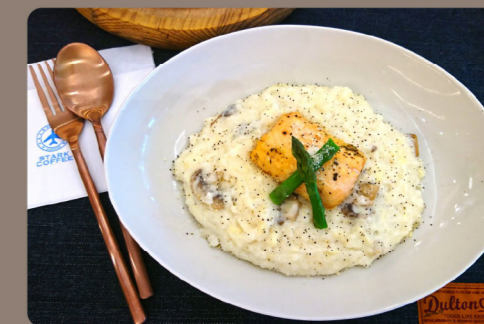
サーモンのクリームリゾット 1099 (1209)