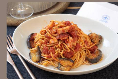
ナスとベーコンのトマトソース 999 (1099)