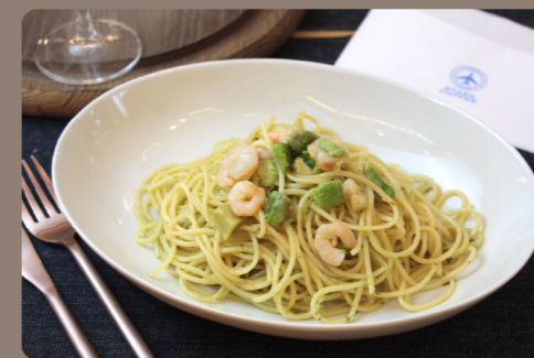
エビとアボカドのバジルソース 999 (1099)