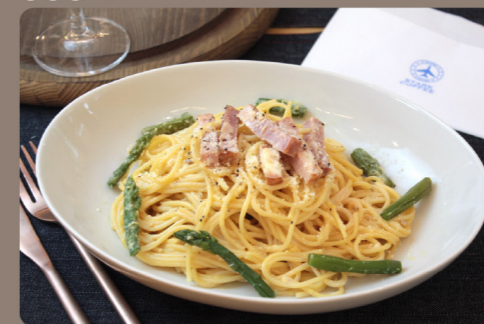
アスパラとベーコンのカルボナーラ 1199 (1319)