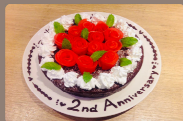
アニバーサリープレート 1000~(1100~)