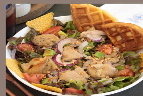
チキンサラダプレート 1199 (1319)