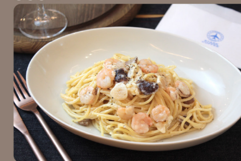
エビとボルチーニのチーズ 1199 (1319)