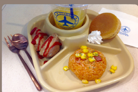
キッズプレート B・ドリンク付き 550 (605)